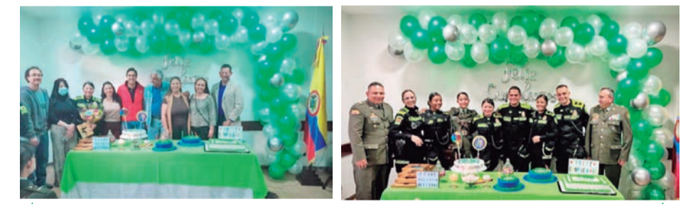
Comité de Seguridad de ASOBEL 2022.