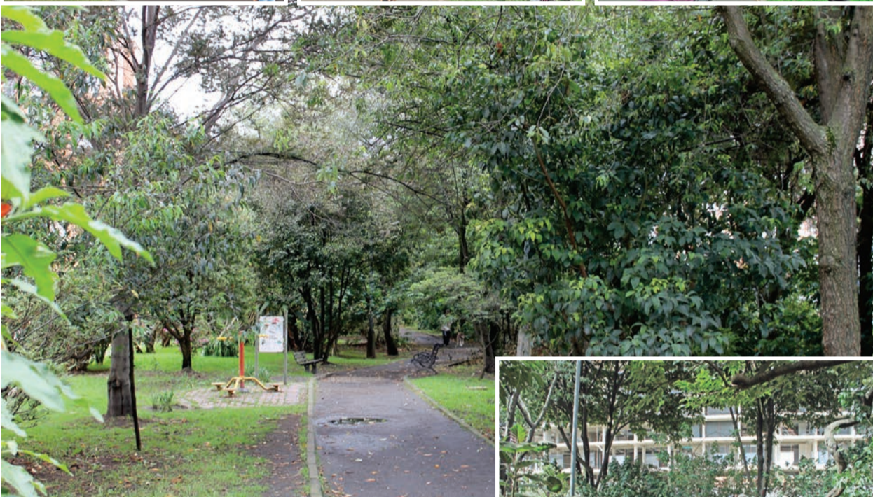
▲ El camino de la vida alberga cientos de especies, que purifican el ambiente del sector y se consolidan como un oasis en medio del caos de la ciudad.