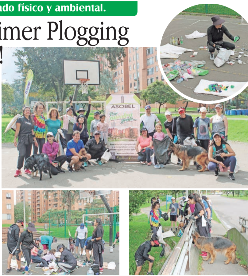
▲ Plogging: Un término que resulta, para varios aficionados del ejercicio, la fórmula perfecta para estar en forma mientras se cuida el planeta.

Un aspecto muy importante de Plogging es el hecho de saber clasificar los residuos que se encuentran en el entorno y también los que generamos en nuestras casas. Esto con el objetivo de evitar contaminar fuentes hídricas, ríos, mares, y que se taponen las alcantarillas de las ciudades por la mala disposición de los