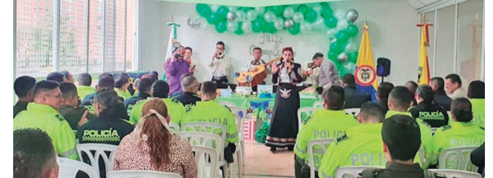
Grupo de mariachis cantando en honor a la celebración.